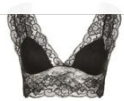
PIECES PCKIMARA - Bustier - black 11.90€